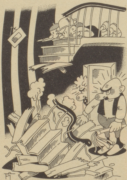
«So etz hämmer eusen Brückekopf errichtet und em Vatter jedi Verbindig abgeschnittel!»

Nach der Abendtafel wurde der Geiger gebeten, ein kleines Musikstück zum Vortrag zu bringen. Paganini willfahrte diesem Wunsche, griff aber jede fünfte Note falsch. Keiner der darüber höchst verwunderten Gäste verlor ein Wort darüber. Nur der Hausherr fragte