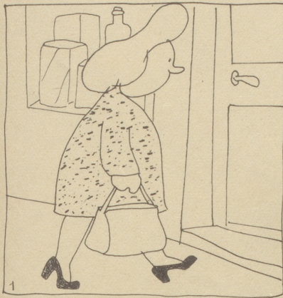
1 Man löse am Ersten des Monats sämtliche Marken der Lebensmittelkarte ein,

Bosco-Würfeli, oder: «Wie teile ich die Lebensmittel-Rationen ein, daß ich einen Monat damit auskomme!!»