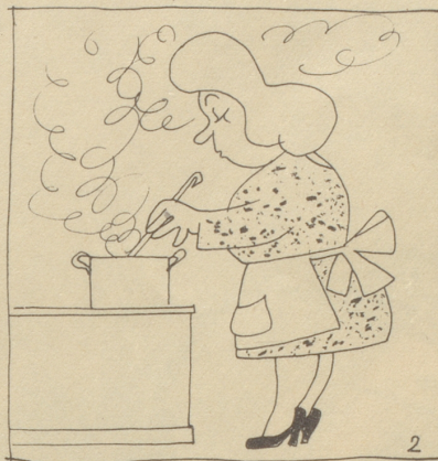
2 dann koche man das Fleisch, die Teigwaren, die Butter, de Chäs — kurz alles bis auf den Kaffee, Tee und Zucker — unter beständigem Rühren so lange, bis die Masse dicklich ist.