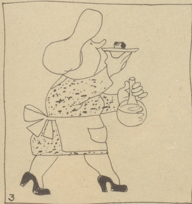
3 Die Masse, welche nach dem Einkochen noch ca. 2500 gr schwer ist, wird nach Erkalten in 60 Würfeli geschnitten. Diese Würfeli — ca. 40 gr schwer — werden täglich je eines zum Mittag- und eines zum Abendessen, serviert.