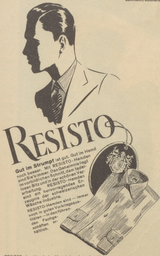
RESISTO das klassische Hemd des eleganten Herrn