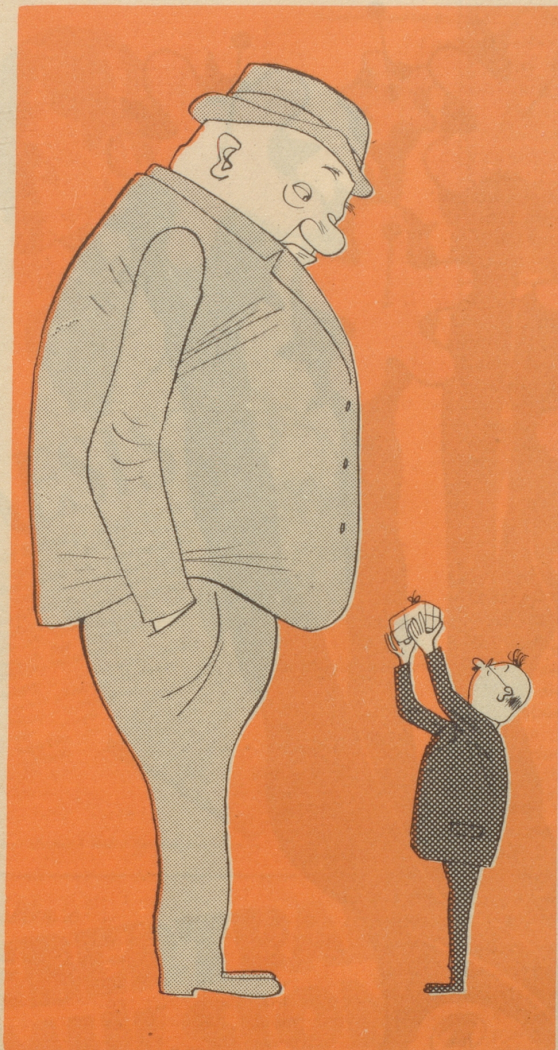
Käufer und Warenbesitzer 1940