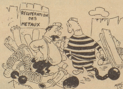
Beim Altstoffhändler «Wieviel zahlen Sie für die Chugle und die Chettle?» Ric et Rac

Und als alles auf den mehr moralischen Höhepunkt der doch natürlichen Handlung wartet, nämlich den Ausdruck