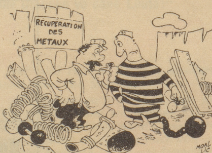
Beim Altstoffhändler «Wieviel zahlend Sie für die Chugle ond die Chettle?» Ric et Rac