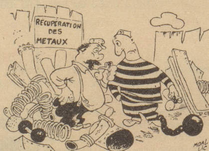
Beim Altstoffhändler «Wieviel zahlen Sie für die Chugle ond die Chettfle?» Ric et Rac

Und als alles auf den mehr moralischen Höhepunkt der doch natürlichen Handlung wartet, nämlich den Ausdruck