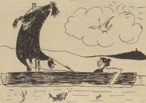
Sonntag am Zürichsee