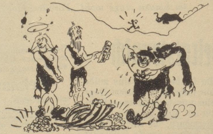
Schon damals gab der Vater seine Tochter nicht ohne weiteres her — —!