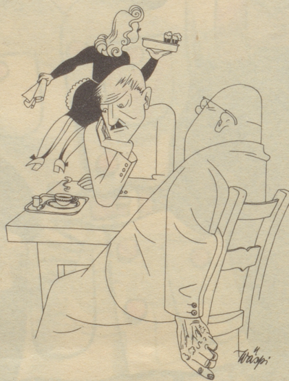
«Was trinksch du da, Tee oder Kafi?» «Frög Zerwierfotchter!»

Er: «Ach weisch, de Bund hät sich verrächnet, drum müend mir em jetz hälfe.» Zü.