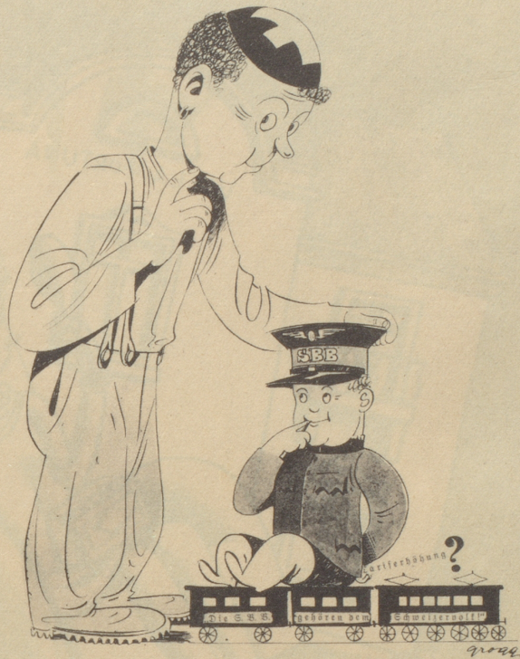
Zum Reklame-Feldzug der S.B.B.

„Da isch gwüß gwüß öppis im tue, das Es-Bébéli isch-mr e chli zue artig!“