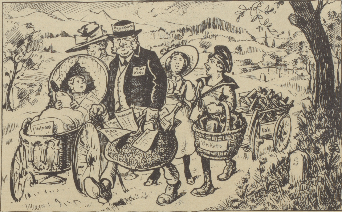
Aus dem Nebelspalter vom 29. Juni 1918