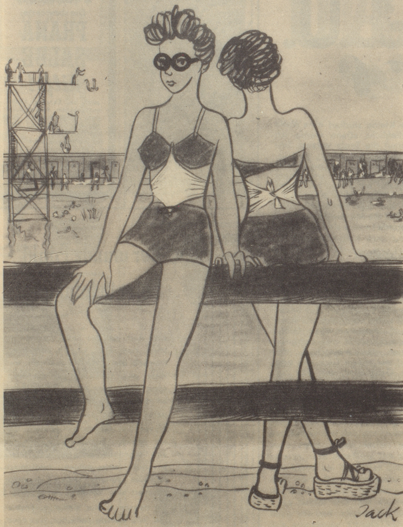
Der Regierungsrat des Kantons Nidwalden verbietet das Tragen von zweiteiligen Badekleidern.

Die Gäste, die nur ein zweiteiliges Badekleid bei sich haben, behelfen sich wie auf der Zeichnung sichtbar