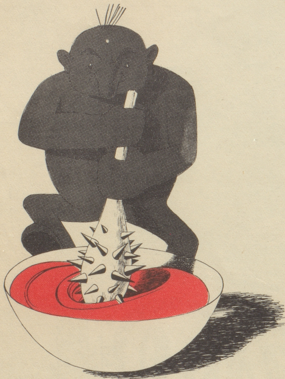
„Sooli jetz hätses“