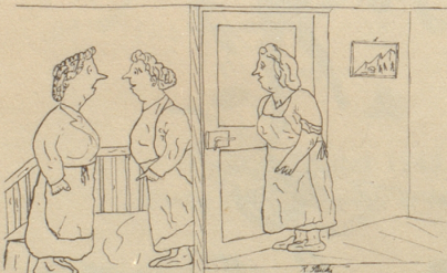
Nachrichtendienst und Schwarzbörser