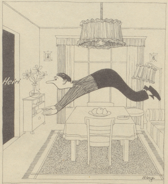
Geschirrabtröchnen, hopp, die Gattin rüeft! Was Du im Dienst gelernt — hier wirds geprüeft.