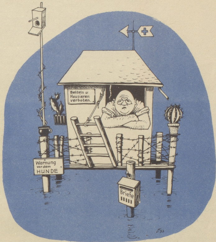
Des Egoisten Spezial-Reduit

Termin: Mittwoch, den 7. Juli 1943. Nur Postkarten senden mit dem Vermerk «Preisfrage» an Nebelspalter in Rorschach. Besten Dank zum voraus für jede Mitwirkung. Die am besten gelungenen Antworten werden honoriert.