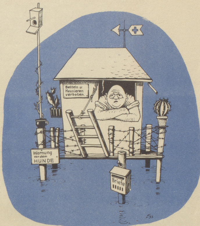
Des Egoisten Spezial-Reduit