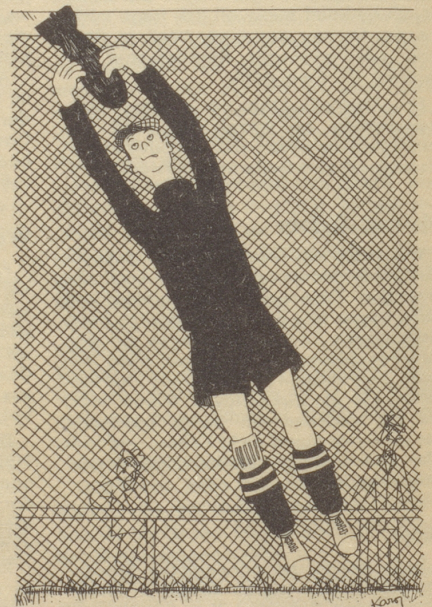
Sport und Sprache „Der Goali hält eine Bombe.“