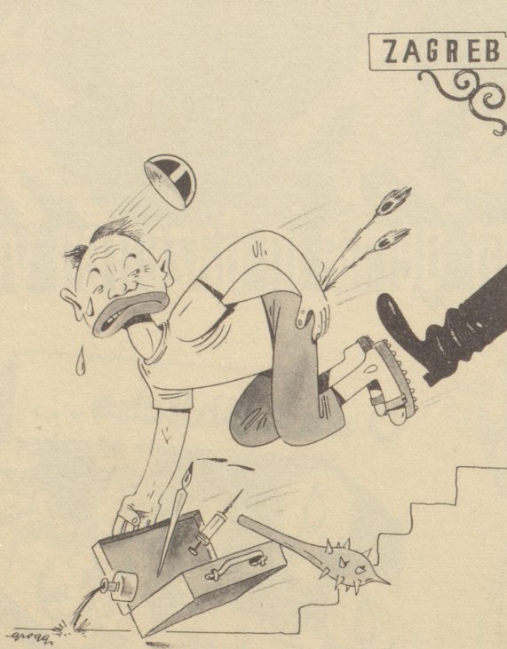
Zagreb hat Franz Burris Hetzagentur gegen die Schweiz verboten.

Den Stiefel erntet Burri Franz, Erwartet hat er Lorbeerkrantz.