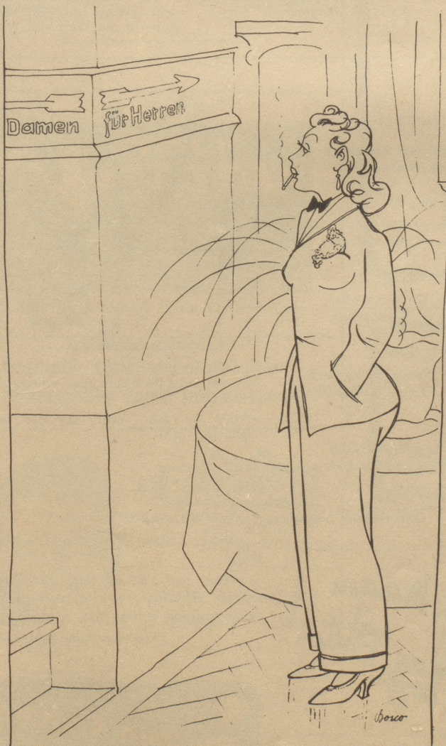
Dilemma im Hotel

«In dieser Bar sind die Tische immer reserviert, aber das Publikum ist es nie.»