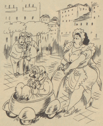
Auf diese Weise hofft die Weise ein halbes Kilo Zucker und drei Dezi Honig mehr zu ergattern.