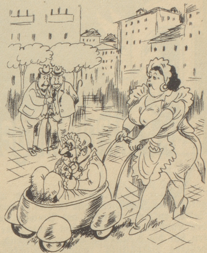
Auf diese Weise hofft die Weise ein halbes Kilo Zucker und drei Dezi Honig mehr zu ergattern. Marc' Aurelio