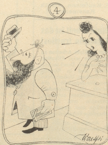
Wie Herr Manchermann heute Schokolade kauft