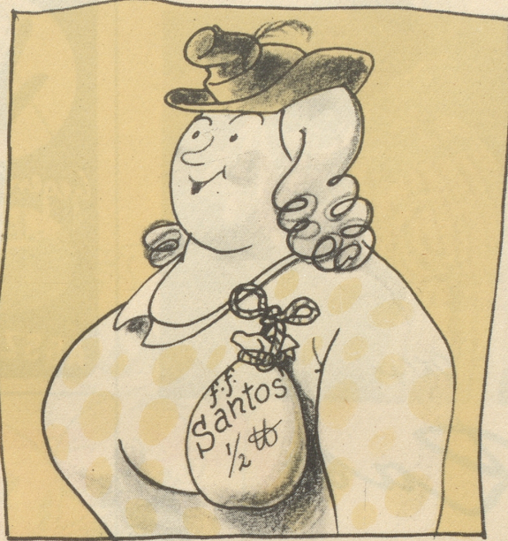
oder es Säckli voll gröschttete Kafi