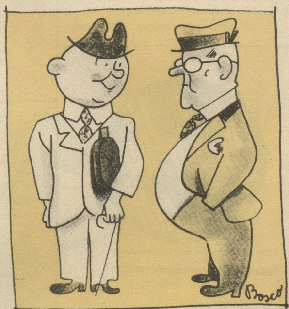
oder es Brikett

„Das wär doch säuglatt derigi Abzeiche!“ „Dumms Züg, usgrächnet Sache, wo so knapp sind.“ „He, me sammlet s' ja nachher doch wieder ii!“