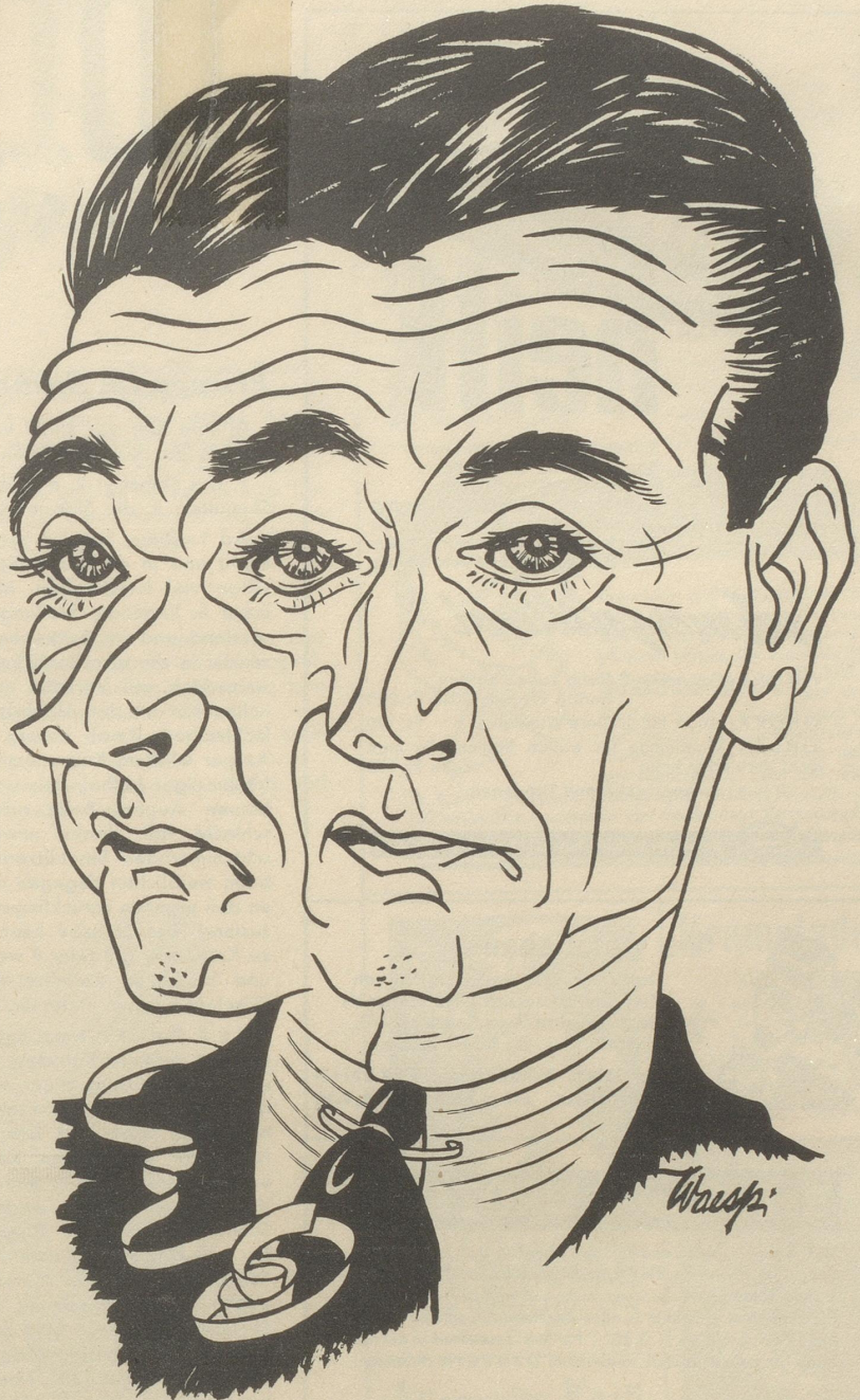
Selbstbildnis am Aschermittwoch

Gestern jedoch geschah etwas, das die schon jahrhundertealte Familienüberlieferung des vererbten Kaminfegerglücks glauben doch stark erschütterte. Wieder auf einem Kommissionsgang begriffen, stieß ich jedoch fünfzig Schritte von meiner Wohnung entfernt auf einen dieser Glücksvögel, der eben ein Haus verließ. Ihm folgte ein zweiter, ein dritter, vierter, fünfter, ja sogar ein sechster! Wie angewurzelt blieb ich stehen. So viel Glücksverheißung war kaum faßbar. Als die ganze Kolonne auf ihren Fahrrädern davon gesaust war, ging ich langsam auf das glückliche Haus zurück. Auf einem großen, blitzblanken Messingschild stand zu lesen: K. u. E. Birnstiel, Kaminfegermeister . . . P. W.