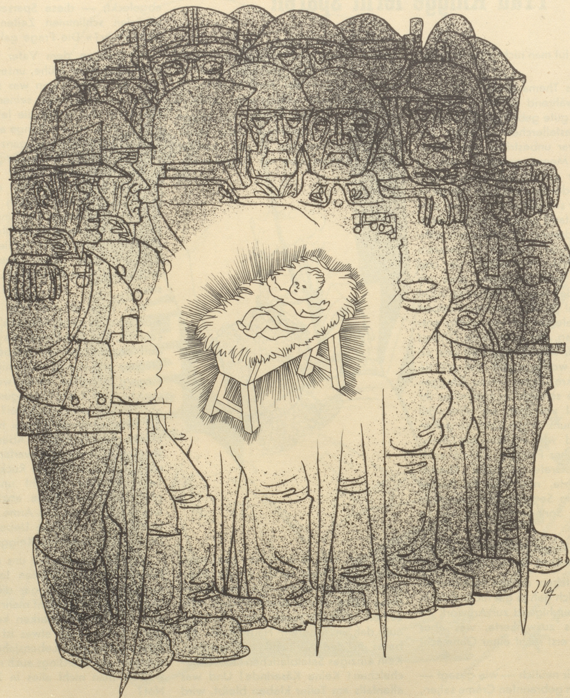
Ein Kindlein will den Frieden bringen