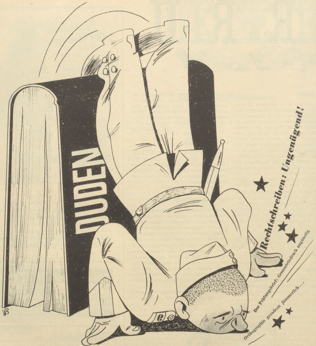
Das Ergebnis der pädagogischen Rekrutenprüfungen