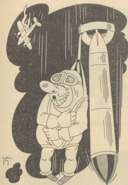
Der zerstreute Pilot