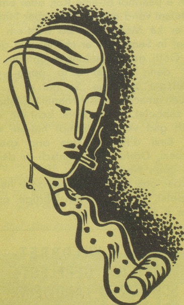
Die Krawatte aus Naturlocken da nützt alls bügle nüt!