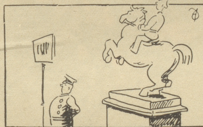
Das disziplinierte Denkmal