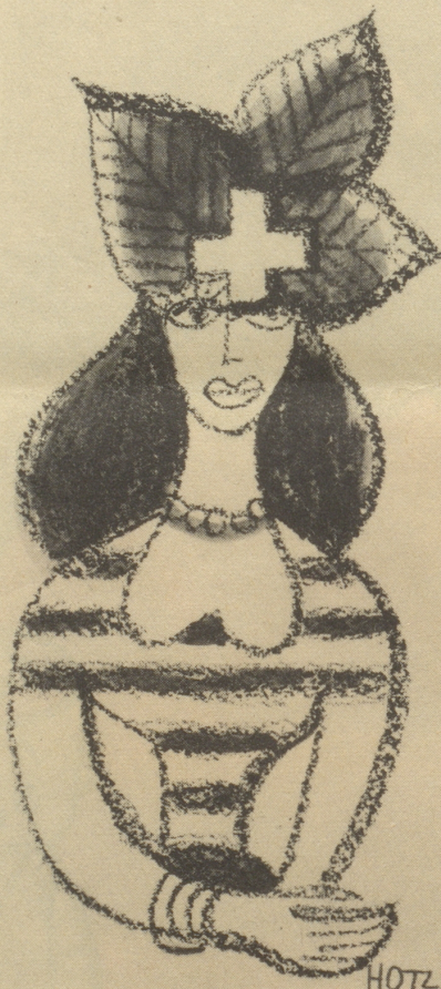
Vorschlag für das Frauen-Sport-Abzeichen

«Diese Riesenschlange, meine Herrschaften, kann ein Schaf verschlingen.» «Beuge dich doch nicht so weit vor, Liebster!» F. H.