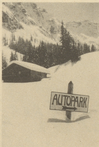
Do nützt au 's Benzin nüt mehl

(Die Ledigen werden froh sein über diese Ausnahme, sonst müßten sie ja zuerst heiraten, um die Zustimmung des Ehegatten beibringen zu können.) Specht