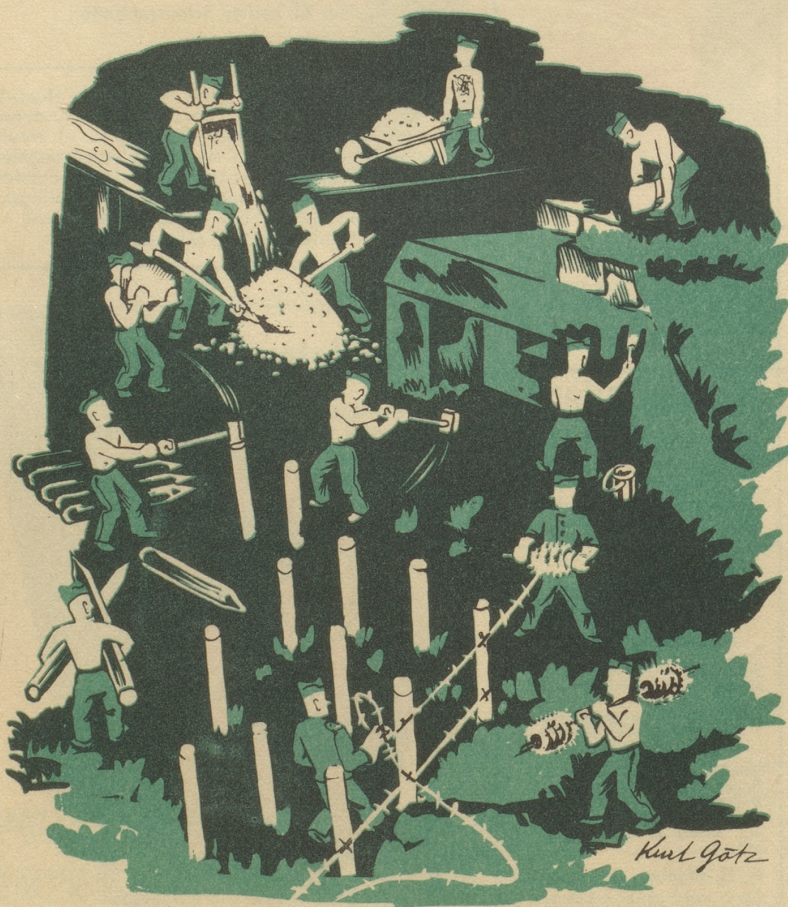
Ein Stück Soldatenleben

Kriegsmobilmachung anfangs September 1939. Ich rücke ein zu meiner Einheit, in der ich aber vollständig fremd bin. Korpsmaterial fassen, und schon bringt uns der Tippel außerhalb der Stadt in ein kleines Nest. Quartier im Schulhaus, 2 Züge in einem Zimmer, in dem rings den Wänden entlang das Stroh zum Lager geschichtet ist. Der Marsch mit Sack und Pack war recht ermüdend, sodafß ich bald nach dem Zimmerverlesen trotz dem ungewohnten Lager in einen tiefen Schlaf verfiel. Tagwache. Stimmengewirr, Aechzen, Fluchen. Auch ich reibe meine Augen