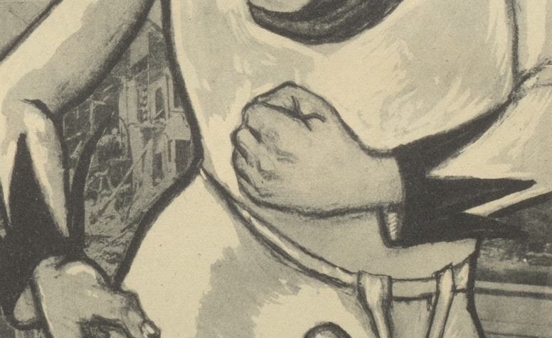
Die vordere Fassade wurde von den im Krieg...