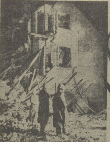
Die Wirkung der Bombenabwürfe im Kreis 5 zwischen Jurestrasse und Heisterstrasse. Neben dem Luftschuttsoldaten rechts sieht man den Bauleiter. (V. H. 1912)