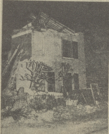
Die Südansicht des zerstörten und eingestürzten Hauses an der Limmatstrasse in Zürich. (V. H. 1912)