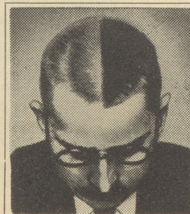
In dem hier beschriebenen Experiment wurde das Haar kurz geschoren und in der Mitte ein Streifen ausrasiert. Während fünf Wochen wurde Silvikrin nur auf der linken Seite verwendet. Das Bild zeigt das Resultat: Zunahme des Haarwuchses um 35 Prozent.

Haar wurde bei allen kurz geschoren. In der Mitte des Kopfes wurde ein schmaler Scheitel ausrasiert, so daß beide Hälften voneinander getrennt waren. Die drei Männer kamen jeden Tag in die Sprechstunde, um sich die linke Kopfhälfte mit dem Präparat einreiben zu lassen, wobei der Arzt Gelegenheit hatte, die Entwicklung zu verfolgen.