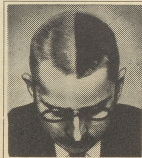
In dem hier beschriebenen Experiment wurde das Haar kurz geschoren und in der Mitte ein Streifen ausrasiert. Während fünf Wochen wurde Silvikrin nur auf der linken Seite verwendet. Das Bild zeigt das Resultat: Zunahme des Haarwuchses um 35 Prozent.

Haar wurde bei allen kurz geschoren. In der Mitte des Kopfes wurde ein schmaler Scheitel ausrasiert, so daß beide Hälften voneinander getrennt waren. Die drei Männer kamen jeden Tag in die Sprechstunde, um sich die linke Kopfhälfte mit dem Präparat einreiben zu lassen, wobei der Arzt Gelegenheit hatte, die Entwicklung zu verfolgen.