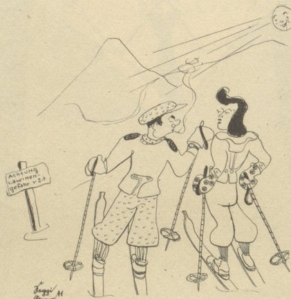
In einem bekannten Innerschweizer Skigebiet war folgende Tafel zu lesen: Lawinengefahr v. 2-4 Uhr.