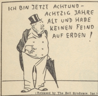
(Released by The Bell Syndicate, Inc.)