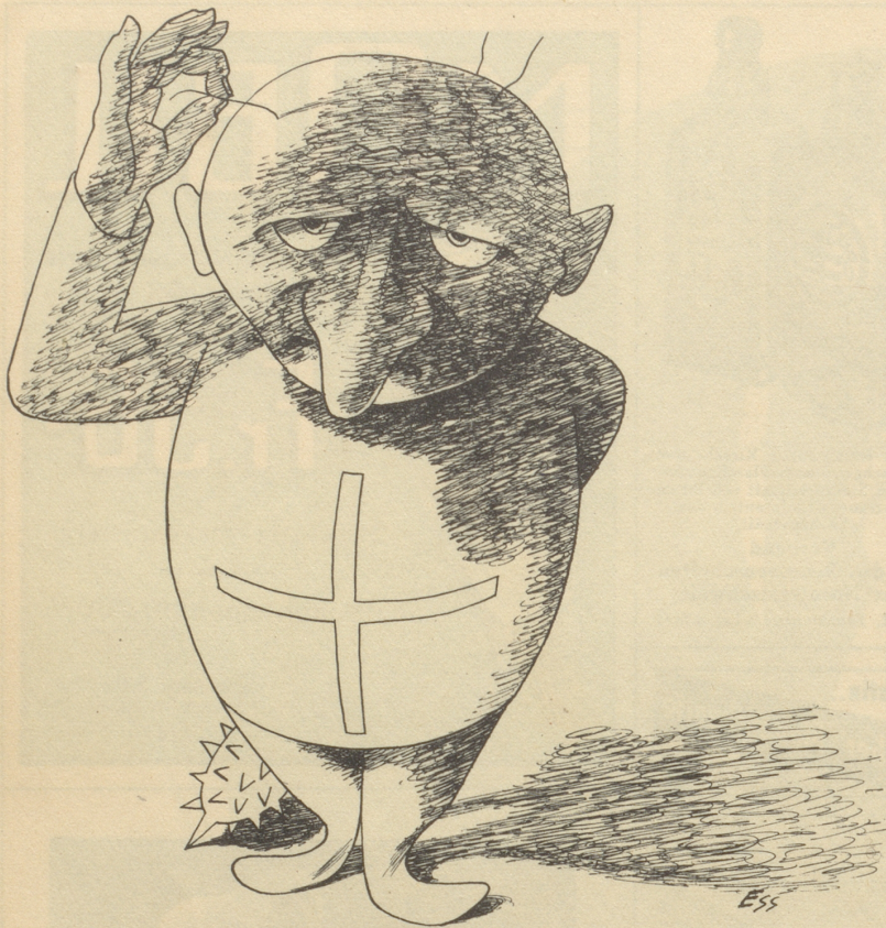
Die verbotene „Nationale Front“ ist unter dem Namen „Eidgenössische Sammlung“ wieder auferstanden.