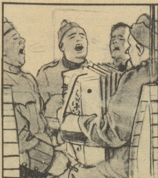
Es geht lustig zu, wenn viele Urlaubser heimreisen, nur sieht man kaum etwas vor lauter Rauch.

4. Komme ich zum End, war das Leben schön, habe ich genützt die Frist. Und ich falle hin und ich falle her, bis der Tod mein lieber Bruder ist.