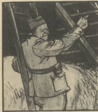
„Da hat's ja Löcher im Dach! Hat keiner ein paar Schindeln im Sack?“