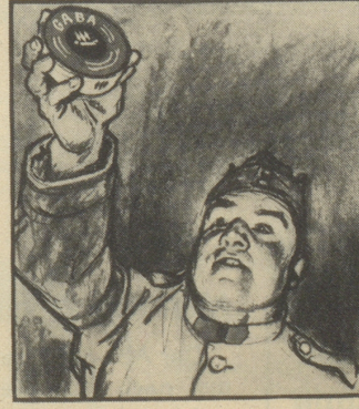
— „Schindeln nicht grad, aber Gaba. Da nimm, dann kriegst Du keinen Schnupfen, wenn's auch zieht.“