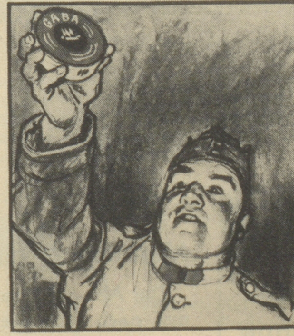
— „Schindeln nicht grad, aber Gaba. Da nimm, dann kriegst Du keinen Schnupfen, wenn's auch zieht.“