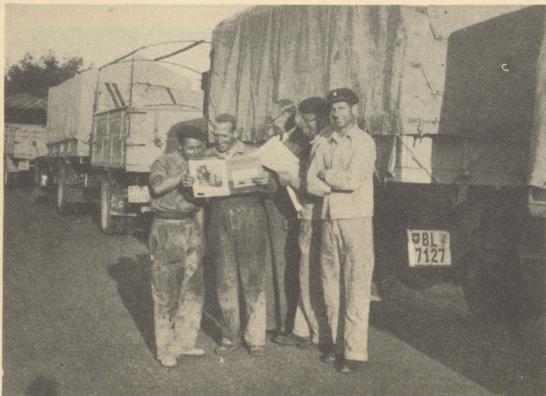
Ein Bildchen von der Schweizer Autokolonne Portugal-Spanien