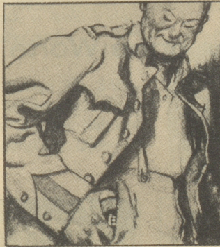
Zum Glück legt die Mutter in jedes Wäschesäcklein auch eine Dose Gaba-Tabletten.