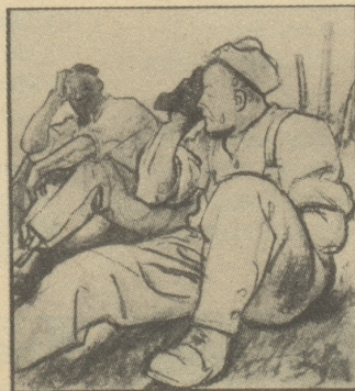
Natürlich kommt man bei der ungewohnten Arbeit ins Schwitzen, und bei dem rauen Winterwetter ist es dann zu einer Erkältung nicht mehr weit.