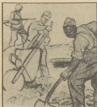
Hacken, Pickeln und Schaufeln, das ist nun sein Tagewerk, seit er an der Grenze steht.