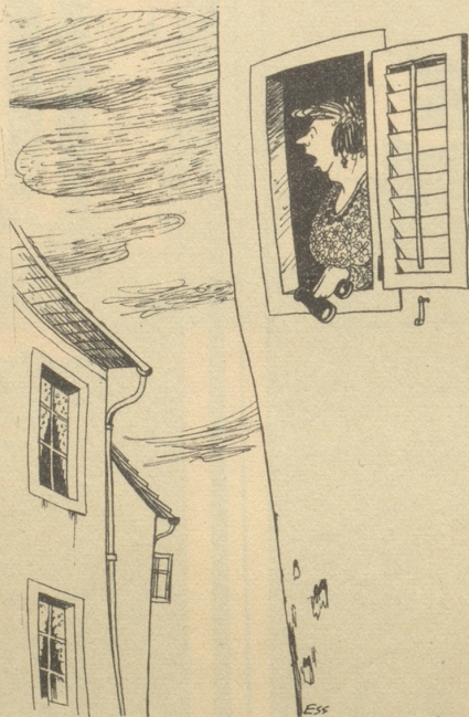
«— scho wieder Butter zum z'Morgel»

Und wir ändern, die wir auf unsern Ankenballen, Speckseiten und Geld-