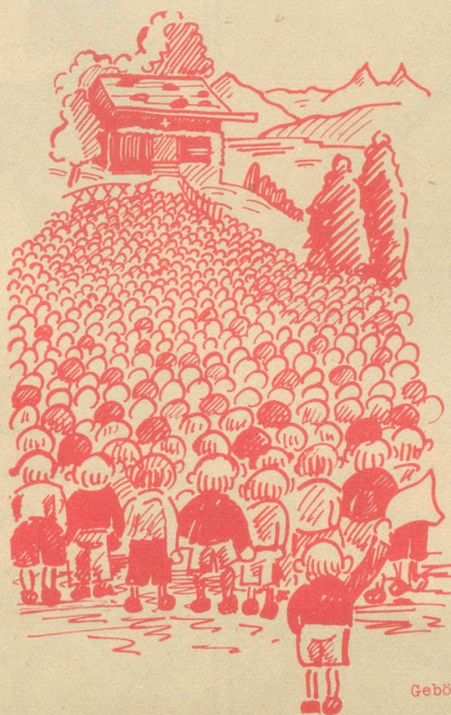
„Von ferne sei herzlich begrüßet!“

Ich nehme die Photo in Empfang und bedanke mich. Nun war der verehrte Mann nichts weniger als eine Filmheldenschönheit. Sein vielsagendes Lächeln jedoch und das überlegene und zugleich gütige Wesen ließen la sale gueule ganz vergessen. -e-