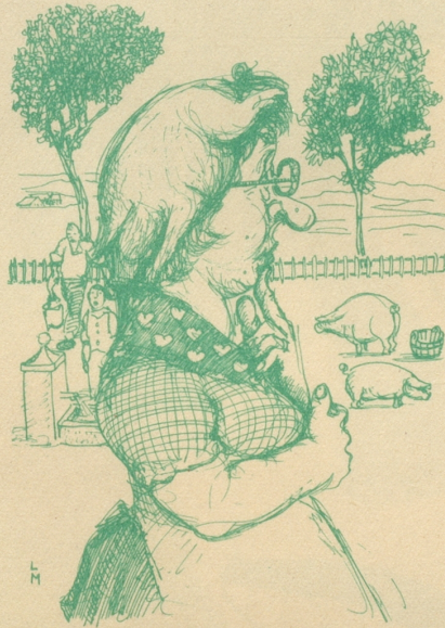
Die u-gmerkig Magd «Wieso säged s' au immer, mir hebed drüü Soue?»

Heute sagt man: «Der brave Mann denkt an sich, selbst zuletzt.» Hagel