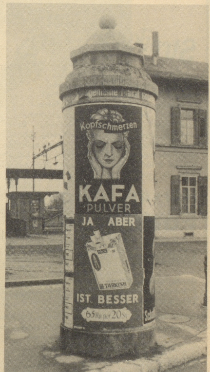
Der unfreiwillige Humor kommt auch auf Liffah-Säulen vor.