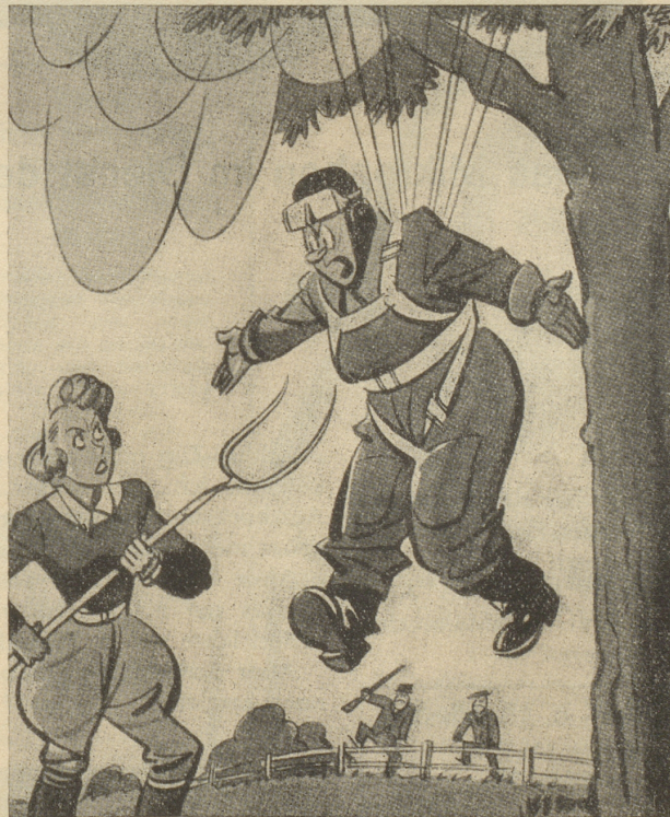
„Min Maa — oder nöd min Maa, i dene Tage chame nöd vorsichtig gneg sy!“ (Humorist, London)