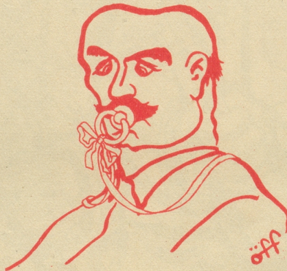
Gegen säuglingshaftes Politisieren!

Unerwünschte Ratschläge wachsen wie ein Unkraut auf dem Boden mensch- licher «Kultur» ... W. F.