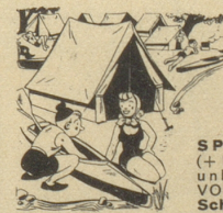
Am Wochenende ziehe aus Mit Deinem eignen Bett u. Haus

Schließlich hat es der gute Herr Professor satt. Und als die Frau sich wieder einmal in der erwähnten Weise ausdrückt, herrscht er sie zornig an: «Jetz säg mer nüme immer: de Herr Ding! Wennst scho sy Name nid chansch stigle, so säg wenigstens: de Herr Substantiv!» fis