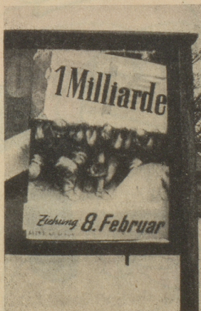
Isch das nüd Ufschnitt?